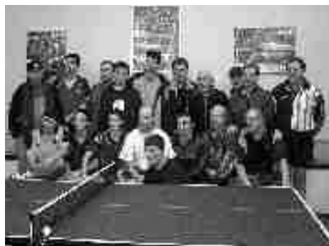
Část členstva oddílu stolního tenisu

- cílem družstva je udržet se v soutěži a umístění v horní polovině tabulky, což nebude v silné konkurenci jednoduché.