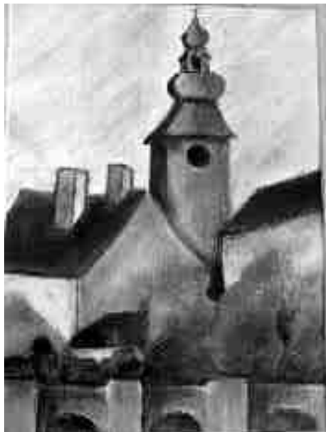
Jeden z moravskotřebovských námětů zastoupených na výstavě.

Obrazy a obrázky Jany Veselé – do 2.10.2005