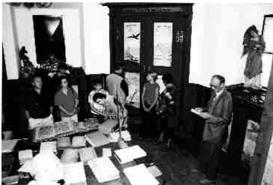
Prohlídka klášterní knihovny.