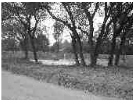
...a po úklidu.

dále pak materiál povahy směsného komunálního odpadu. Na skládce byly zastoupeny i některé druhy odpadů, které musely být uloženy na skládce určené pro odpady s nebezpečnými vlastnostmi. Množství odpadu v celé skládce bylo odhadnuto na 2000 m 2 , což představuje přibližně 3000 t odpadu.