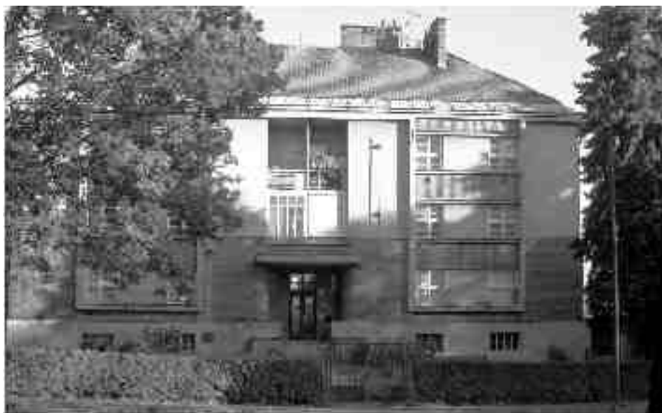
Bytový dům ve Svitavské ulici, or. č. 48, v říjnu 2006

Podle projektu Vojtěcha Vanického byly postaveny také dva obytné domy pro státní zaměstnance. 15. června 1927 psal architekt