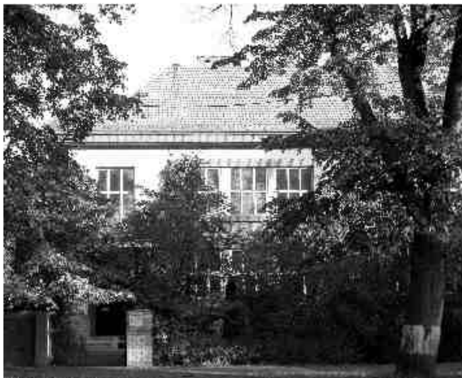
Budova někdejší české menšinové školy („Domeček“) v říjnu 2006

Letos v květnu proběhlo v Moravské Třebové natáčení dalšího dílu televizního cyklu „Šumná města“, věnovaného moderní architektuře. Byl nazván „Šumné Třebové“, protože se zabývá problematikou České a Moravské Třebové. Právě dílo Vojtěcha Vanického je v dokumentu důležitým prvkem, který jinak hodně odlišná města spojuje. (Vysílání pořadu odložila Česká televize na podzim příštího roku, v Moravské Třebové by se pravděpodobně na jaře měla uskutečnit předpremiéra.)