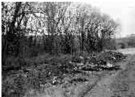
Rybníček před úklidem...

Černá skládka se nacházela na místě vypuštěného rybníka nedaleko obce Boršov. Převážnou část černé skládky tvořily odpadní stavební materiály (cihly, menší betonové bloky atd.),