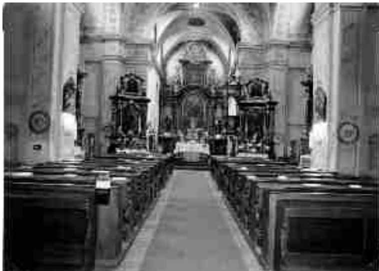
Pohled do interiéru kostela sv. Josefa.

Slovem „Patschunkele“ označovali němečtí obyvatelé Hřebečska slavnost porciunkule, konanou každoročně v Moravské Třebové, sídle řádu Menších bratří františkánů.