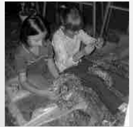
LT KREATIV 2005 v termínu od 8.8. do 14.8. 2005, který probíhal v DDM v Moravské Třebové a byl určen pro „šikovné ruce“ tvořivých dětí od 1. 9. třídy. (foto nejmladší účastnice LT).