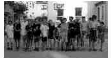
LT Florbalteam v termínu od 25.7. do 31.7. 2005 v Rájci Jestřebí se zaměřením na florbal a jiné aktivity, které byly součástí celotáborové hry Svátky v roce (foto z etapy CTH)

V průběhu měsíce července a srpna 2005 probíhaly letní tábory organizované Domem dětí a mládeže Mor. Třebová.