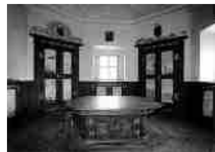
Pohled do barokní knihovny kláštera.