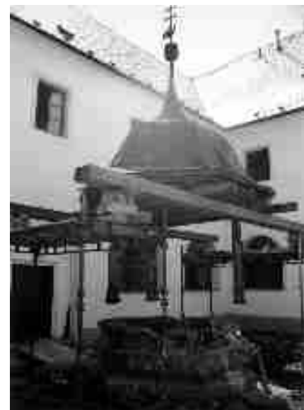
Klášterní studna v průběhu opravy.