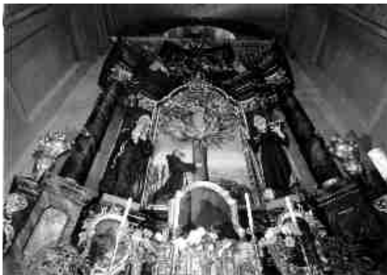
Hlavní oltář kostela sv. Josefa.