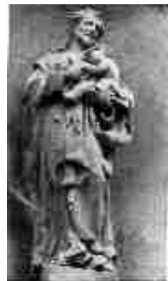
Jiří Anonín. Heinz: Sv. Josef – plastika nad vchodem do kláštera

Hlavní program, organizovaný komisí památkové péče ve spolupráci s muzeem, probíhá tradičně druhou sobotu v září, kdy se pořádají podobné akce i na jiných historických významných místech v Evropě. V Moravské Třebové se letos soustředí pozornost na františkánský klášter. V sobotu 10. 9. ve 14 hod. zde proběhne vyhodnocení soutěže Moravská Třebová, jak ji neznáme. Soutěžní fotografie budou vystaveny v klášterní kapli sv. Petra