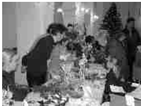
Z Mikulášského jarmarku 2004

ZŠ Palackého vyhlašuje 1. ročník celostátní výtvarné soutěže POD MODROU OBLOHOU