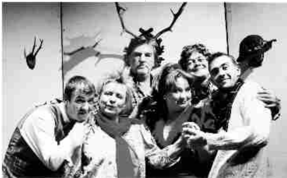
Z představení „Lovu zdar“

Předprodej na připravovanou divadelní představení zahajujeme již 1.12.2005