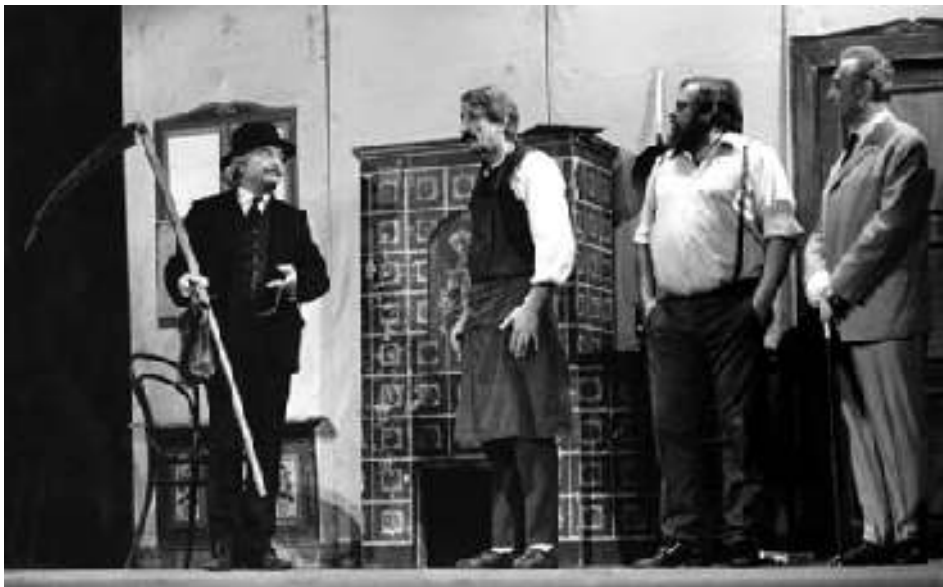
Posel z Liptákova

Stejně jako většina ostatních představení Divadla Járy Cimrmana, sestává Posel z Liptákova ze dvou částí série odborných referátů,