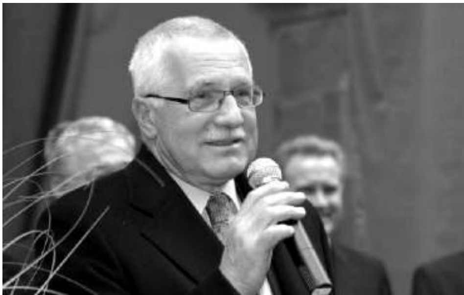
Prezident Václav Klaus