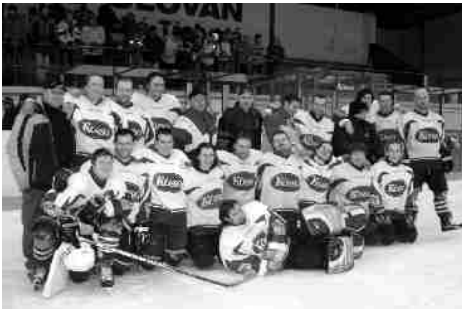
Mužstvo HC Slovan A po závěrečné skončené sezoně

Novinka této sezony - vyřazovací playoff na tři vítězná utkání - Slovanu sedla parádně. Postupový duel svedl ke konfrontaci Pardubického a Hradeckého kraje družstva Náchoda a Slovanu. Zdánlivě jednoznačný závěrečný výsledek 3:0 nad kvalitním soupeřem z Náchoda nebyl vůbec jednoduchý. Soupeř zařadil do svého kádru několik velice kvalitních hokejistů, a to dokonce i s extraligovou zkušeností. První zápas na ledě soupeře dotáhli Třebovští k vítězství až po samostatných nájezdech, v nichž projevila převaha Slovanu na postu brankáře. Druhý duel na domácím ledu skončil ziskem dalšího bodu. Třetí utkání v Náchodě sehráli domácí velice pasivně s podstatně menší vůlí po vítězství než moravskotřebovský Slovan. Ke