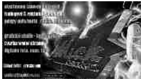
Duben - měsíc bezpečnosti Sleva na obnování autosalů až 20% ceník a informace na www.folie.educa

Policistům se podařilo dopadnout pachatele vzloupání do rodinného domu v Pacově. Dne 21.1. odtud devatenáctiletý muž z obce u Moravské Třebové odcizil věci v hodnotě téměř 10 tis. Kč. Ve věci byly zahájeny úkony trestního řízení pro