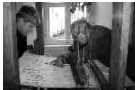
Restaurátoři uvádějí do provozu starý tkalcovský stav ze sbírkového fondu muzea

Když bylo hodně práce, pracovalo se v jednom obydlí i na pět, někdy dokonce sedmi stavech. Znamenalo to, že prakticky všechno ostatní zařízení se z chalupy muselo vystěhovat. I v případě, že stál ve světnici pouze jeden stav, nezbyvalo příliš mnoho místa pro další vybavení interiéru, ve kterém se zpravidla také předla, soukala a navjela příze. Otec rodiny seděl často od rána do noci za stavem, manželka a starší děti vykonávaly další práce spojené s textilní výrobou, domácností a hospodářstvím. Do školy si děti chodily spíše odpočinout. Malé děti si hrály na zemi s cívkami, hadříky apod., kojenci byli v hlučném prostředí často uspávaní pomocí „cumlu“ namočeného v makovém odvaru, někdy dokonce i v kořalce. V noci spaly ženy a děti v lepším případě v komoře, v horším na „baráku“ - primitivním lůžku vyrobeném z prken a špalků. Muži spávali většinou na zemi, v létě na půdě nebo v síni na rozložené slámě. Jídelniček tkalcovských rodin byl velmi chudý a jednotvárný, převažovala v něm zapražená, většinou zelná polévka, nekvalitní chléb, hrách, proso a cikorka.