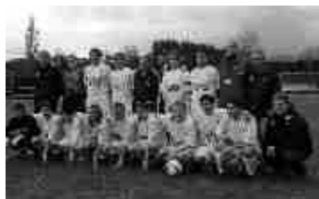
„A“ muži po vítězství nad mužstvem Stolan