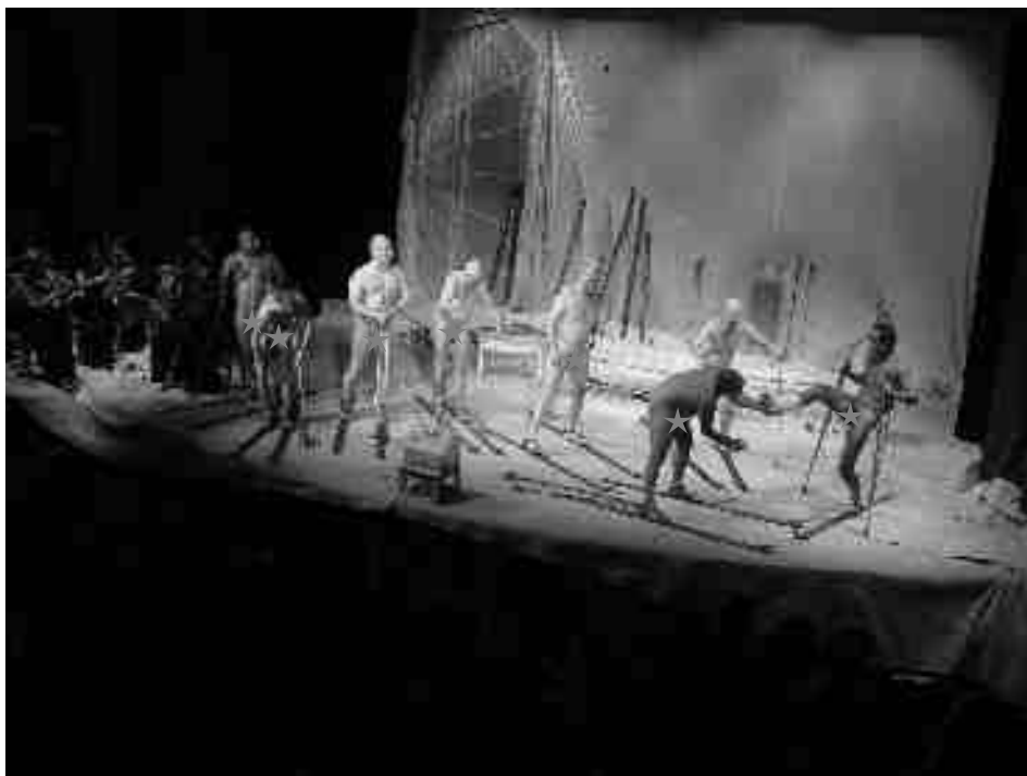
Ukázka z představení „Ty, který lyžuješ“