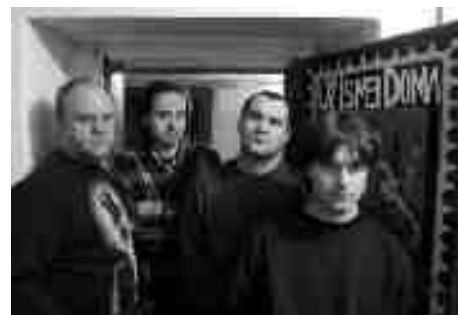
Skupina Už jsme doma