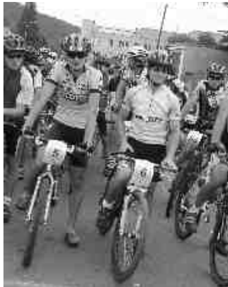
Několik minut do startu

Počasí cyklistům přálo, kdo nechtěl jen tak sedět doma, přišel a zúčastnil se bez ohledu na šance. V tom slova smyslu Babí léto nikoho nezklamalo, někteří jen zehrali na defekty.