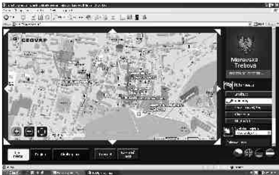
Turistický informační systém

V rámci prvního projektu – „Propagační kampaň turistických produktů a volnočasových aktivit Regionu MTJ“ – byly vydány nové propagační materiály, hrazena účast na veletrzích, podpořeny konkrétní akce a festivaly a na začátku nové turistické sezóny se objeví také reklamními spoty v rádiích a inzeráty v novinách. Cílem je přiblížit potenciálním turistům největší atraktivitu, a to nejen ve městě, ale také v širším okolí. Pozornost se soustředí především na nově zrekonstruovaný zámek v Moravské Třebové, který v novém roce čekají převratné změny.