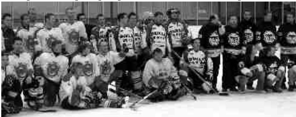
Tři nejúspěšnější týmy. Zleva Merida, Dukla Brno, Dukla Praha