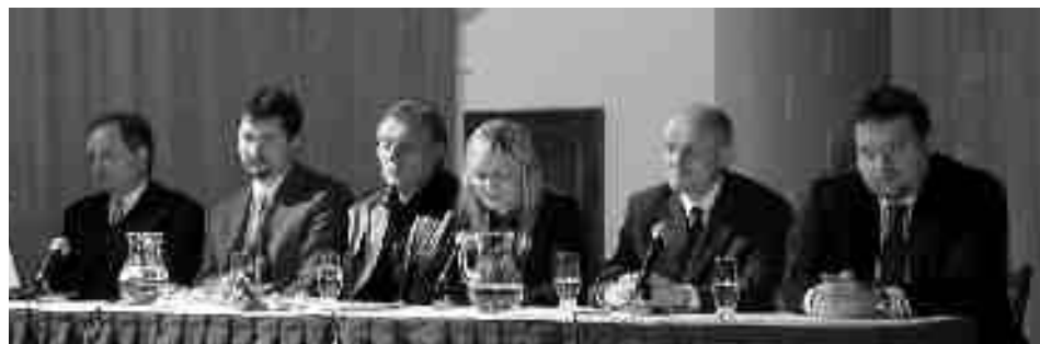
Tvůrci projektů cestovního ruchu

Druhým významným projektem je Turistický informační systém (TIS). Jak již sám název vypovídá, měl by návštěvníkům města poskytnout informace v komplexní a systematické podobě. Obsahuje prozatím čtyři jazykové mutace, kromě češtiny, angličtiny a němčiny funguje také v holandském jazyce. „Systém je budován jako otevřený, takže bude možné jej rozšiřovat,