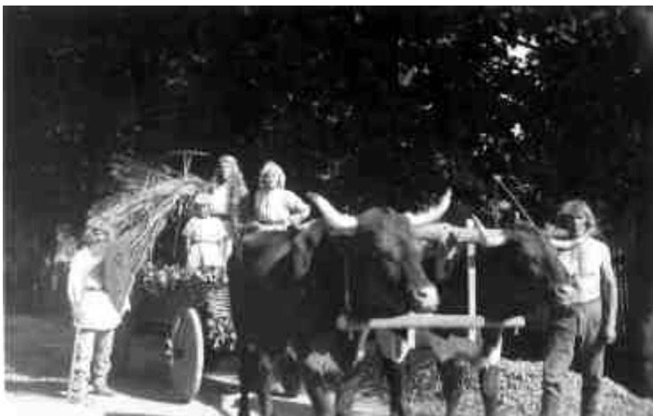
„Kolonisté z 13. století“ na dožínkové slavnosti v Moravské Třebové roku 1937